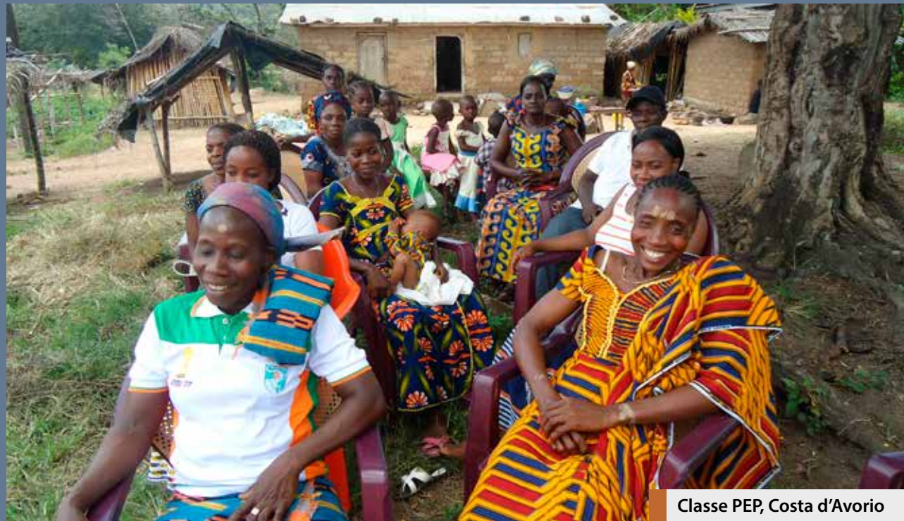
Classe PEP, Costa d'Avorio